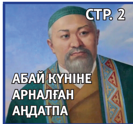
АБАЙ КҮНІНЕ АРНАЛҒАН АҢДАТПА

Читайте нас на сайте sarangazeti.kz , а также в Instagram Facebook YouTube LinkedIn TikTok VK Odnoklassniki MySpace Last.fm Bandcamp Deezer Spotify SoundCloud Podomatic YouTube Vimeo Dailymotion Vevo YouTube Vimeo Dailymotion Vevo