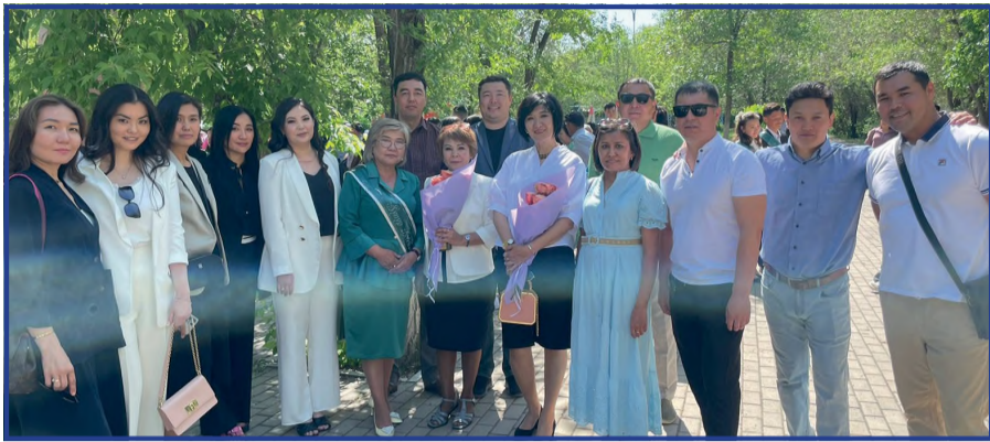
2003 жылғы түлектер

Осыдан 31 жыл бұрын, 1992 жылы Абай атындағы жалпы білім беретін мектебінің табалдырығын аттап, бірінші қазақ сыныбына қабылданған алғашқы түлектер өздерінің алтын ұяларына келіп, оқу жылының аяқталу салтанатына қатысты. 20 жылдан кейін бас қосқан түлектер алдымен білім ордасына еніп, кішіпейілдік көрсетіп, білім нәрімен сусындатқан ұстаздарына сәлем берді. Бір сәт партаға отырып, сағыныш сезімдері мен балалық, жастық дәурендерін еске алысты. Түлектер оқушы кездерінде өткерген қызықты сәттерін, ұмытылмас 11 жылын еске алды. Кездесуде түлектер ұстаздарына жылы лебіздері мен тілектерін арнап, алғыстарын білдірді. Өздері білім алып, түлеп ұшқан білім ордасына салмақты сый-сияпатын ұсынуды да ұмытпады.