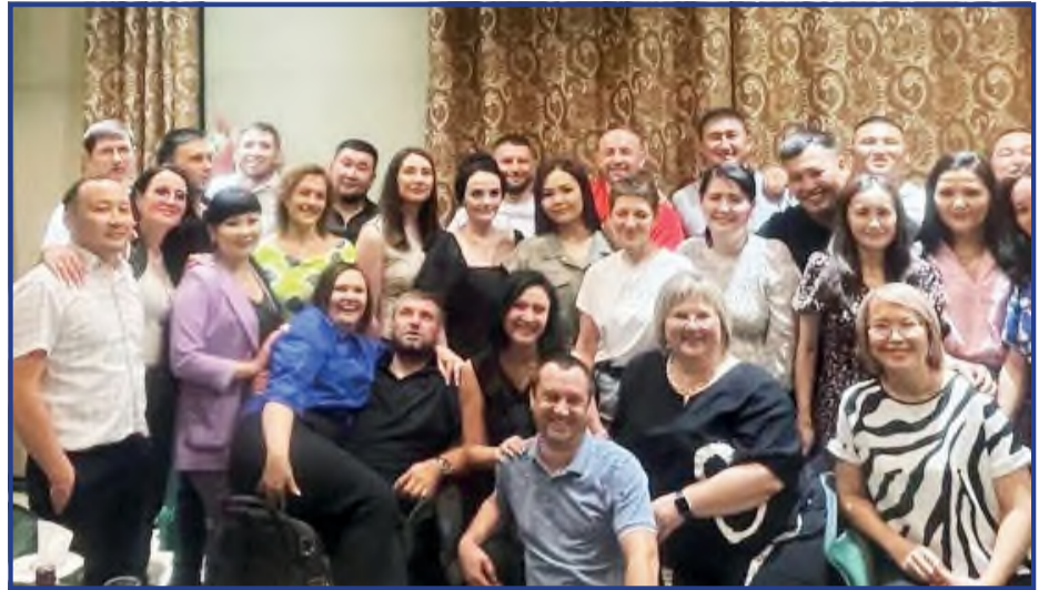
Выпускники 2003 года

Кажется, совсем недавно отзвенел последний школьный звонок, прошла напряжённая пора выпускных экзаменов, выпускной вечер... Каждый из нас, оглядываясь на школьную жизнь, спросит себя: «Что значит для меня школьные годы?». И большинство счастливо улыбнётся, потому что в памяти остались те увлекательные уроки и интересные мероприятия, школьные друзья и весёлое время на переменах. И школа, конечно, помнит своих выпускников.