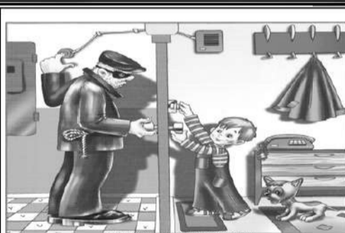
Ребёнок один дома.

В каком возрасте ребёнка уже можно оставлять одного? Тут всё индивидуально. Имеет важность возраст ребёнка, уровень его самостоятельности и степень вашего доверия ему. Как только вы решили приучать ребёнка оставаться на какое-то время одному дома, обратите внимание на некоторые важные детали: