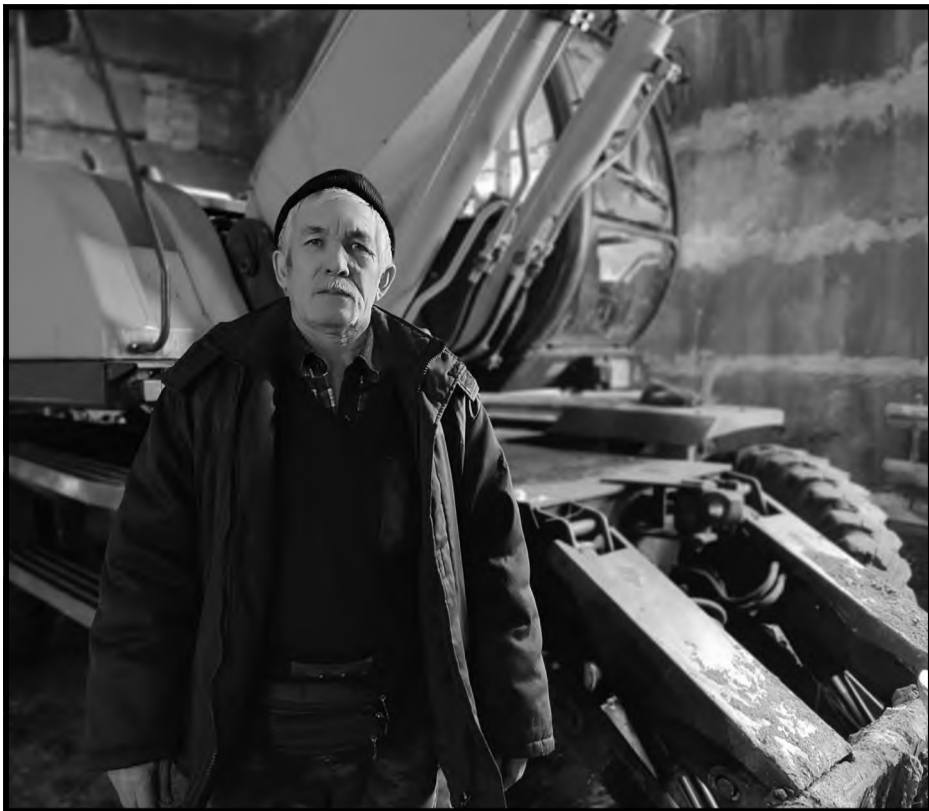
ЖҰМЫСШЫ – МЕРЕЙЛІ МАМАНДЫҚ