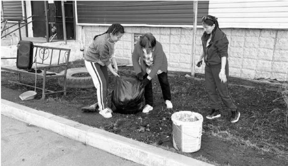
4 сәуір күні Қарағанды облысы бойынша жалпы облыстық сенбілік өтті.

Облыстық сенбілік барысында тұрғындар қаламыздың көркеюіне өз үлесін қосып, аулаларын қыстан қалған қоқыс-қалдықтардан тазартты. Тіпті, кейбір аулаларда ақтау жұмыстары жүргізіліп, ағаштардың түптері қопсытылды.