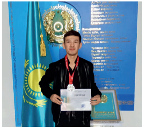
Четвертого апреля в Караганде прошел четвертьфинал III открытого первенства Сената Парламента Республики Казахстан по шахматам «Senat Open - 2026».

На площадке этого престижного и представительного турнира собрались депутаты маслихатов, государственные служащие, ветераны, сотрудники силовых структур, работники образования, культуры, здраво-