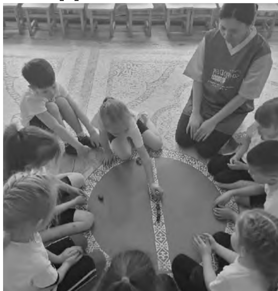
Надежда ЦХАЙ

У каждого из нас бывают в жизни моменты, когда хотелось бы что – то поменять. И именно эти изменения, когда выходишь из зоны комфорта, играют решающую роль и позитивно сказываются на дальнейшей жизни.