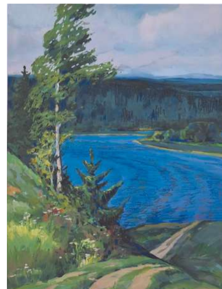
Свежий ветер на Иртыше

истории их создания. Рассматривая альбомы с его работами, мы смогли окунуться в прошлое города, отраженное в его картинах. Ознакомиться с историей прошедших десятилетий.