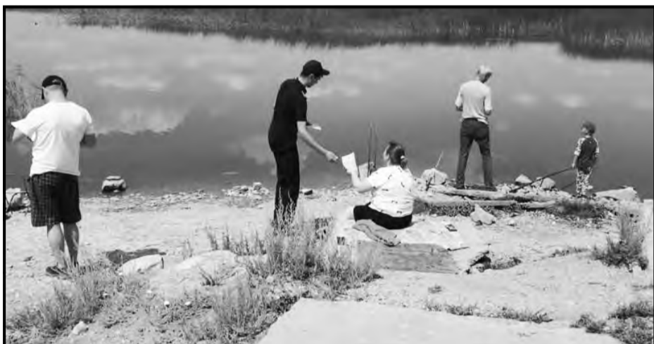
ОЧС г. Сарани

В целях предупреждения населения и предотвращения ЧС в воде, а также нарушений отдыхающими правил в общественных местах с 08.07.2023 г. по 09.07.2023 г. сотрудниками Отдела по ЧС г. Сарани совместно с ГУ «ОМПС ОП г. Сарани», ГУ «Отдела образования г. Сарани» и ГУ «Отдела ЖКХ, ПТ, АД и ЖИ г. Сарани» проведены профилактические рейды по водоемам г. Сарани. Оперативной группой пройдены все запрещенные места для купания, проинструктировано 89 человек, с выдачей рекомендации в виде памяток.